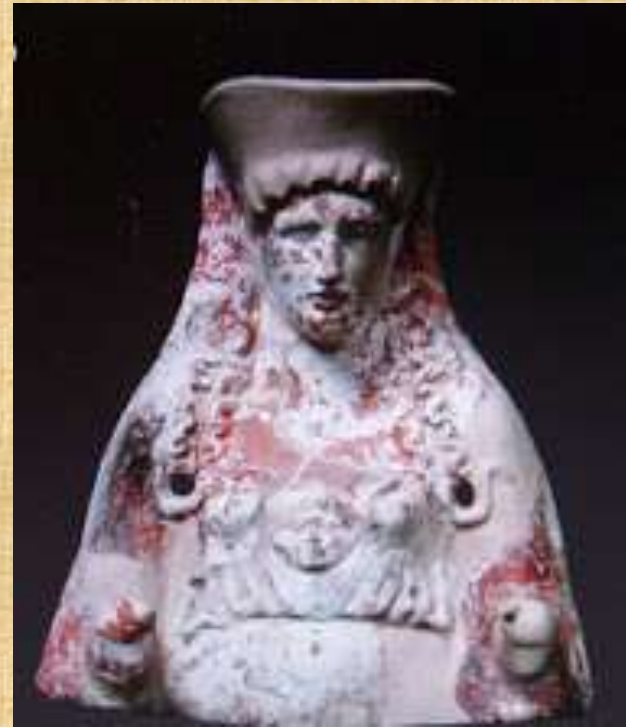
Ιτωνία Αθηνά, πήλινο ειδώλιο, βρέθηκε σε αρχαίο νεκροταφείο της Αλιάρτου (βλ. Β. Αραβαντινός: "Το Αρχαιολογικό Μουσείο των Θηβών", ΟΛΚΟΣ, 2010), Πηγή: Του Κου Πάρι Βαρβαρούση -Πανεπιστήμιο Αθηνών, http://aliartos-boiotias.blogspot.gr/2011/07/blog-post_5074.html