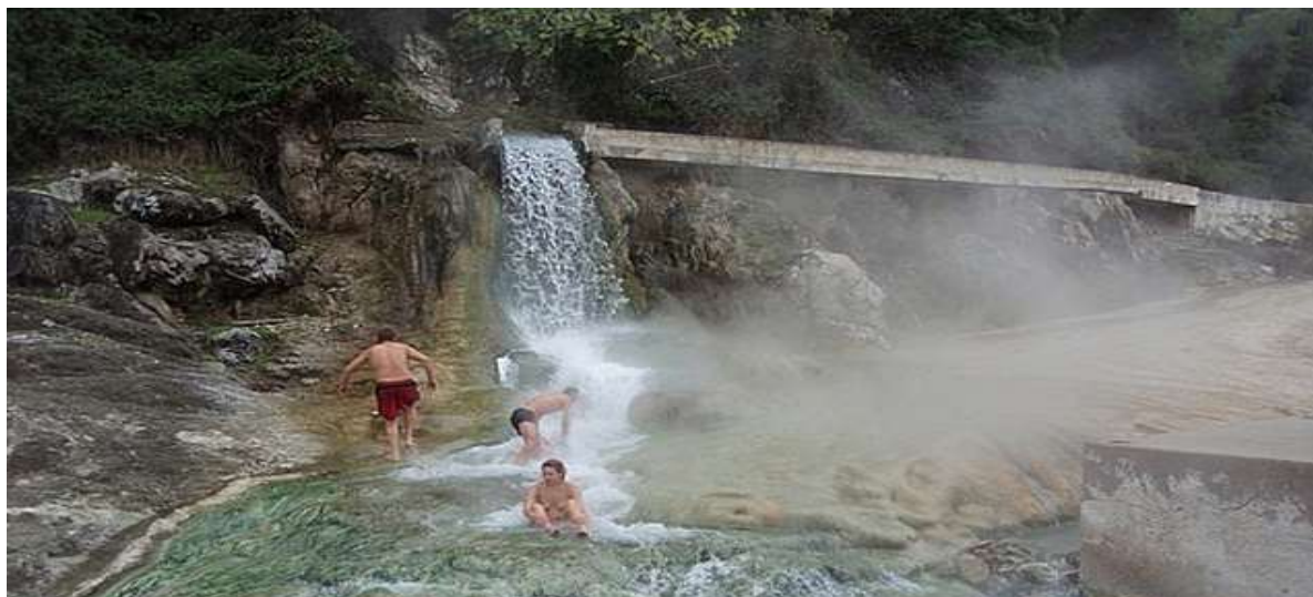
ΙΑΜΑΤΙΚΑ ΛΟΥΤΡΑ ΘΕΡΜΟΠΥΛΩΝ