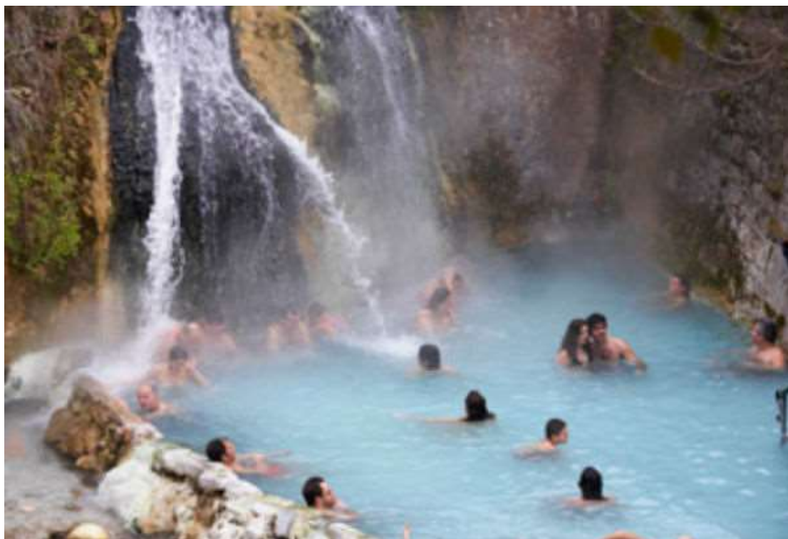
Λουτρά Πόζαρ στο Νομό Πέλλας

Ο Ιαματικός τουρισμός είναι η ειδική μορφή τουρισμού η οποία περιλαμβάνει όλες τις δραστηριότητες και σχέσεις προσωρινής διακίνησης και διαμονής ανθρώπων οι οποίοι έχουν στόχο την πρόληψη ,την διατήρηση και την αποκατάσταση της σωματικής και ψυχικής υγείας καθώς και ευεξίας τους, με τη χρήση φυσικών ιαματικών πόρων. Πρόκειται για μορφή τουρισμού που μπορεί να αναπτύσσεται καθ' όλη τη διάρκεια του χρόνο και σχετίζεται με το πολυτιμότερο αγαθό, την υγεία. Επιπλέον, δίνεται η δυνατότητα σε άτομα με ειδικές ανάγκες και ασθενείς με χρόνιες παθήσεις, όπως νεφροπαθείς, καρδιοπαθείς, καρκινοπαθείς κ.ά., να ταξιδεύουν απρόσκοπτα σε τουριστικούς προορισμούς που επιθυμούν.