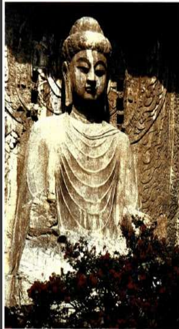
Κολοσσιαίος Βοϊδάς στο Λούγγ-μεν Κίνα. Παριστάνει τον κεντρικό, απόλυτο Βοϊδά 7ος αι. μ.Χ.

(Ζάο Φουζάν, Κινέζος ακαδημαϊκός, «Το Βήμα» 10-4-1985).