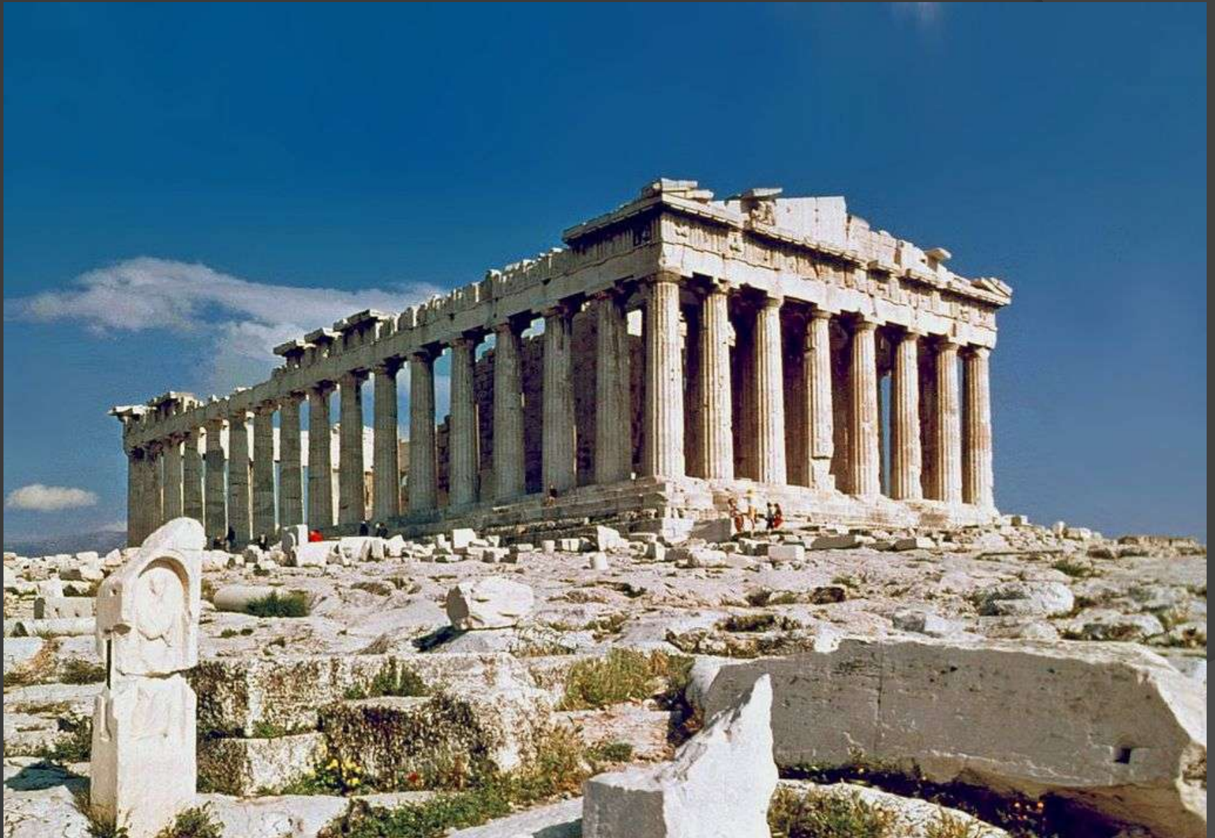
Εικόνα 2: Άποψη του Παρθενώνα