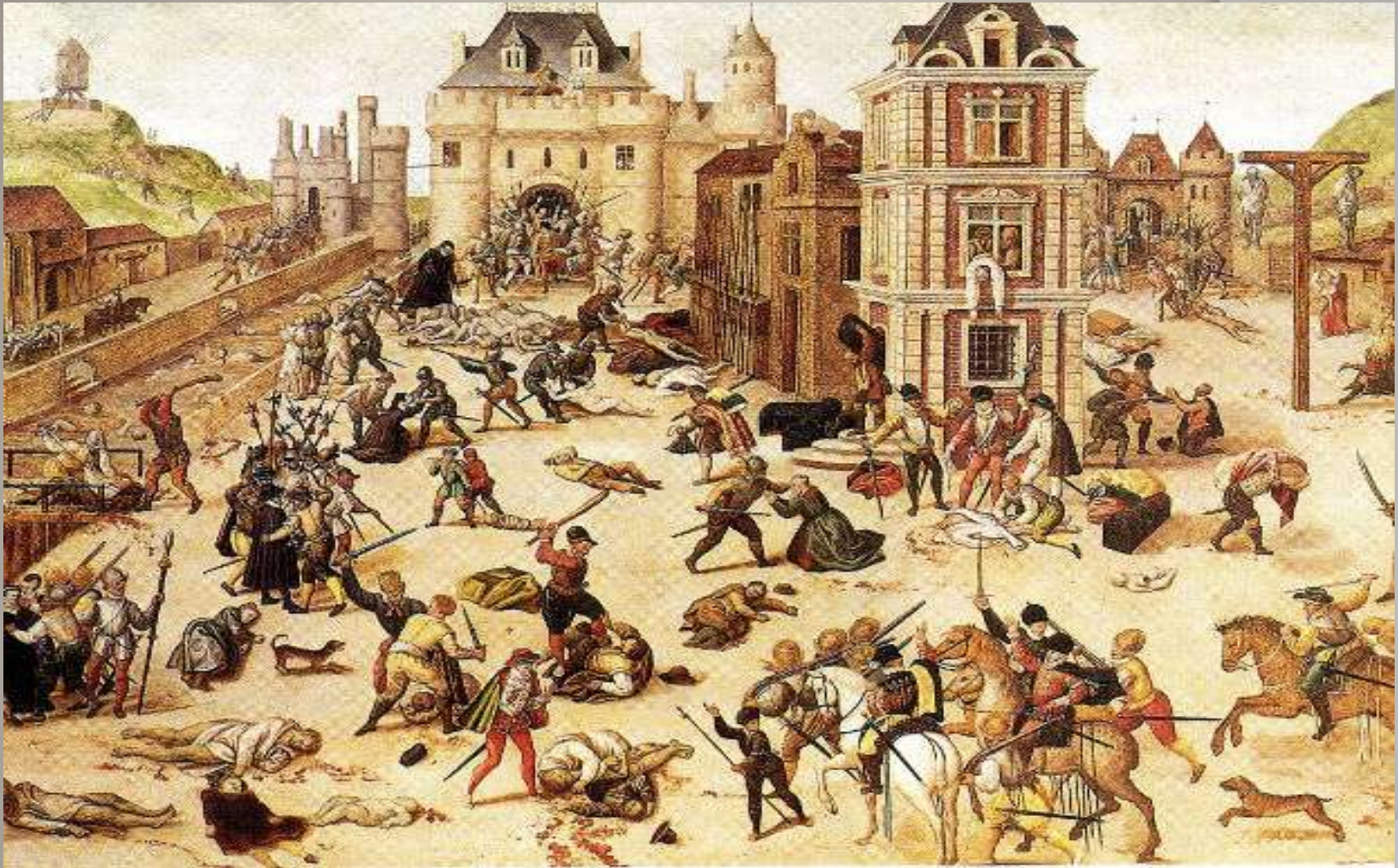
Η σφαγή του Αγίου Βαρθολομαίου, πίνακας του Φρανσουά Ντιμπουά