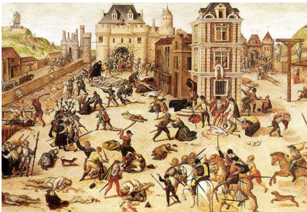
Εικόνα 6: Η σφαγή του Αγίου Βαρθολομαίου, πίνακας του Φρανσουά Ντιμπούά