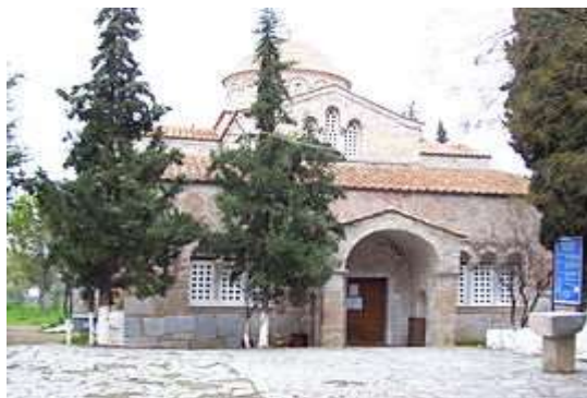
Εικόνα 12: Παναγία η Σκριπού