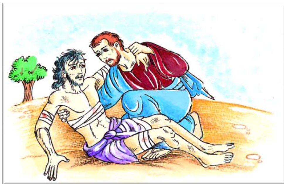
Εικόνα 3: Καλός Σαμαρείτης