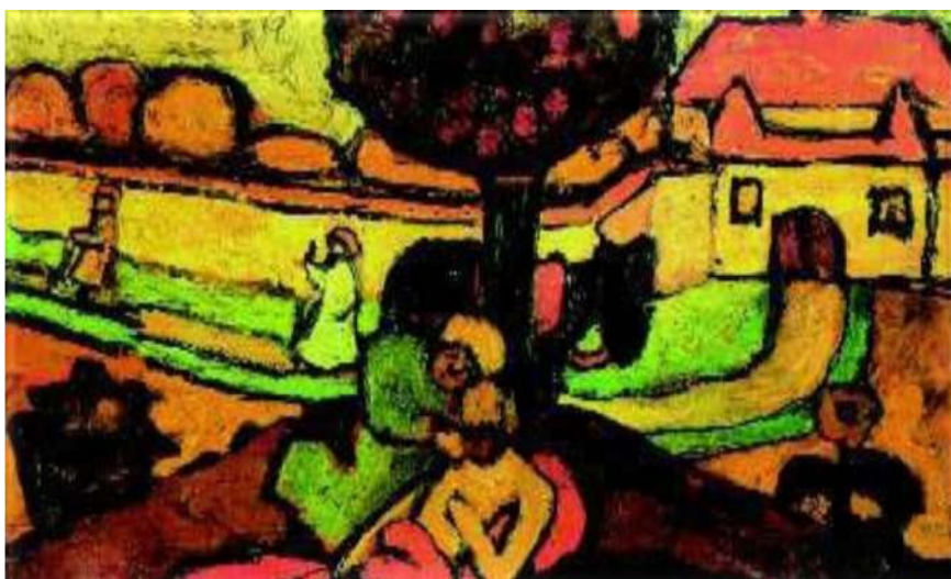
Εικόνα 4: Ο σπλαχνικός Σαμαρείτης, Ζωρζ Ρουό (Rouault, 1871 - 1958)

Ανάλογη στάση με του καλού Σαμαρείτη καλούμαστε να δείξουμε όλοι οι χριστιανοί. Να μάθουμε να μην περιφρονούμε ανθρώπους λόγω της διαφορετικότητάς τους. Οι αδύναμοι, οι φτωχοί, οι αλλόθρησκοι, οι πρόσφυγες, οι λαθρομετανάστες, είναι όλοι εικόνες του Θεού που πρέπει να σπλαχνιζόμαστε. Όμως δεν είναι μόνο η υλική βοήθεια την οποία καλούμαστε να προσφέρουμε σε αυτές τις ευάλωτες ομάδες, αλλά και οι προσευχές στον Θεό γι αυτούς που αποτελεί μια εκδήλωση αγάπης. Η Εκκλησία μας απορρίπτει την όποια εκδήλωση ρατσισμού.