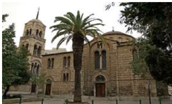
Εικόνα 12: Αγία Τριάδα (Ρωσική εκκλησία)