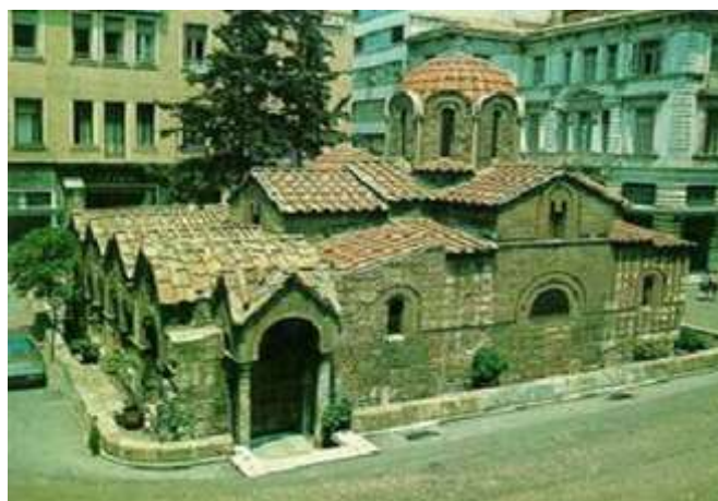
Εικόνα 11: Παναγία Καπνικαρέα

Σύνθετος σταυροειδής ναός στην Αθήνας με τρούλο, ο οποίος στηρίζεται σε τέσσερεις κίονες με ρωμαϊκά κιονόκρανα. Κτίσθηκε στα μέσα του 11ου αιώνα σε ανάμνηση της Εισόδου της Θεοτόκου στον Ναό του Κυρίου. Λίγο μετά τη θεμελίωση του ναού, στη βόρεια πλευρά του προστέθηκε παρεκκλήσι με τρούλο αφιερωμένο στην μνήμη της Αγίας Βαρβάρας. Στη δυτική πλευρά υπάρχουν εντοιχισμένα γλυπτά και επιγραφές. Η εικόνα της Πλατυτέρας στο Ιερό του ναού είναι έργο του Φώτη Κόντογλου, ενώ και οι λοιπές αγιογραφίες είναι έργο του ίδιου και των μαθητών του και χρονολογούνται το 1942.