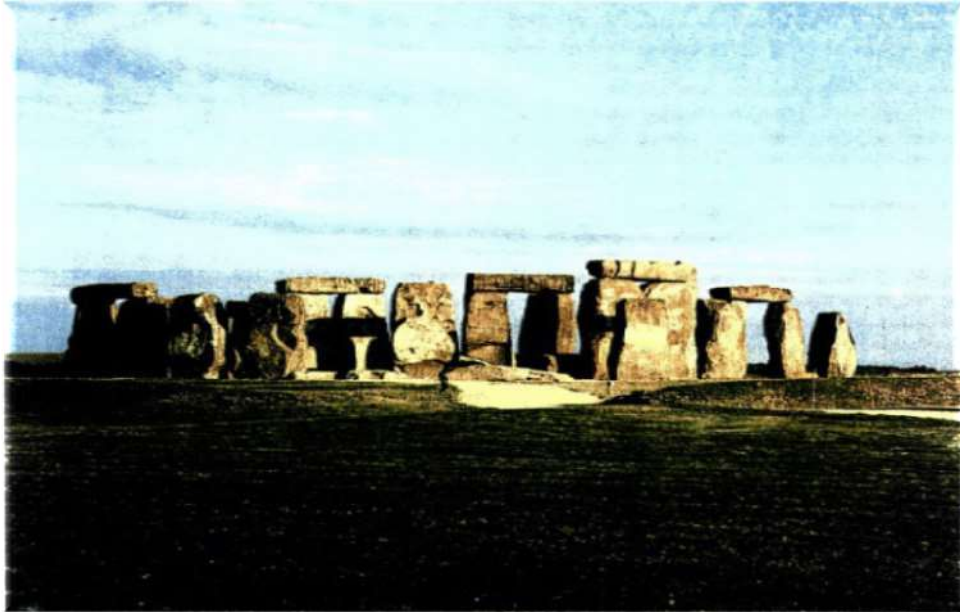
Εικόνα 1: Το μεγαλιθικό μνημείο του Στόουνχεντζ, που υπήρξε, κατά πάσα πιθανότητα ναός του ήλιου