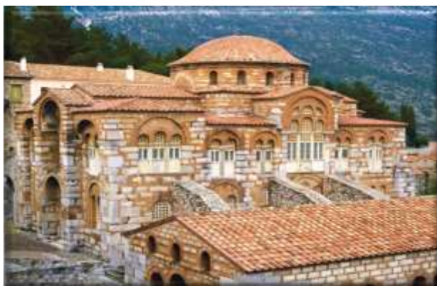
Εικόνα 13: Μονή Οσίου Λουκά