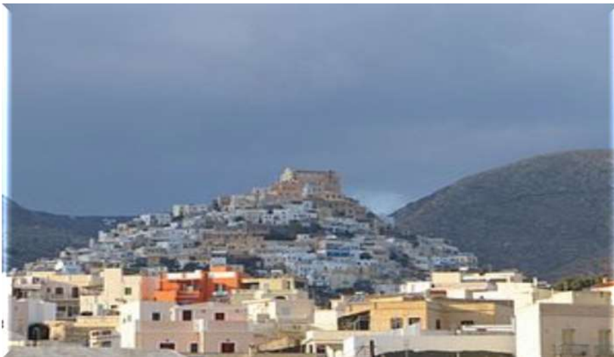
Εικόνα 10: Άνω Σύρος, Ναός του Αγίου Γεωργίου, έδρα της Επισκοπής Σύρου,

Μέρος των ποικίλων θρησκειών στη χώρα μας αποτελεί και ο καθολικισμός με δύο κύρια παρακλάδια τον ρωμαιοκαθολικισμό αλλά και τον Ελληνοκαθολικισμό (Ουνίτες). Οι πιστοί της πρώτης κατηγορίας εντοπίζονται κυρίως στις Κυκλάδες αλλά και στα Επτάνησα οι οποίοι αυξήθηκαν τα τελευταία χρόνια λόγω των αλλοδαπών που ήρθαν στην Ελλάδα. Αριθμούν περίπου 200,000 μέλη. Ενώ οι πιστοί της δεύτερης κατηγορίας ανέρχονται στους 5,000 και κατοικούν κυρίως στην Αθήνα. Αποτελούν κοινότητα του βυζαντινού λειτουργικού τύπου και λέγονται Ελληνόρυθμοι Καθολικοί ή Ουνίτες.