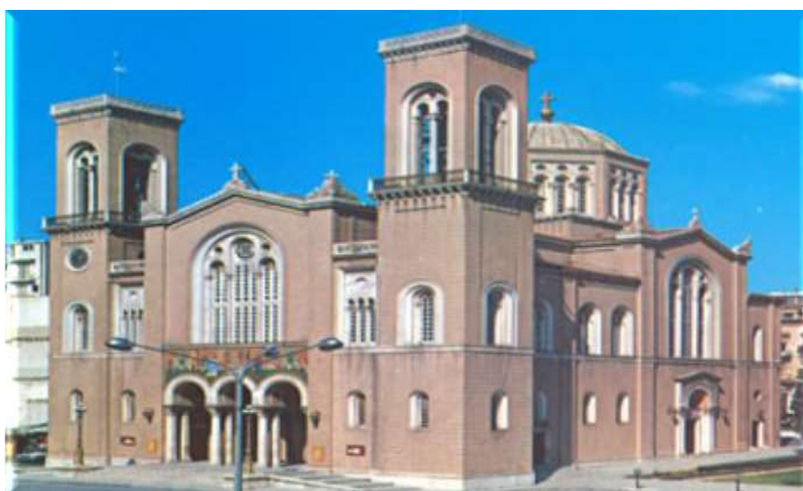
Εικόνα 9: Μητροπολιτικός Ναός Αθηνών