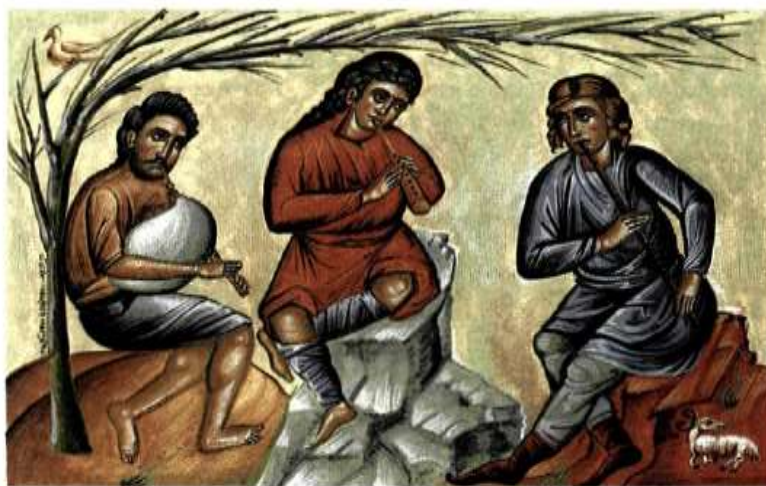
Εικόνα 5: Ὅπως ἡ ποικιλία τῶν ὀργάνων παράγει ἀρμονία ἐτσι καὶ ἡ ετερότητα μπορεῖ νὰ συμβάλει στὴ συνεργασία. Μικρογραφία 1998. Χειρ. Νικολάου.

Αυτή την αλήθεια για την χριστιανική πίστη πρέπει να κατέχει κάθε πιστός και να μην αναγκάζει ή κρίνει κανέναν από τους συνανθρώπους του να επιλέξει τα δικά του πιστεύω, να μην κρίνει τα άτομα με βάση τις μεταξύ τους διαφορές αλλά τα κοινά τους και κυρίως τα πνευματικά τους χαρίσματα.