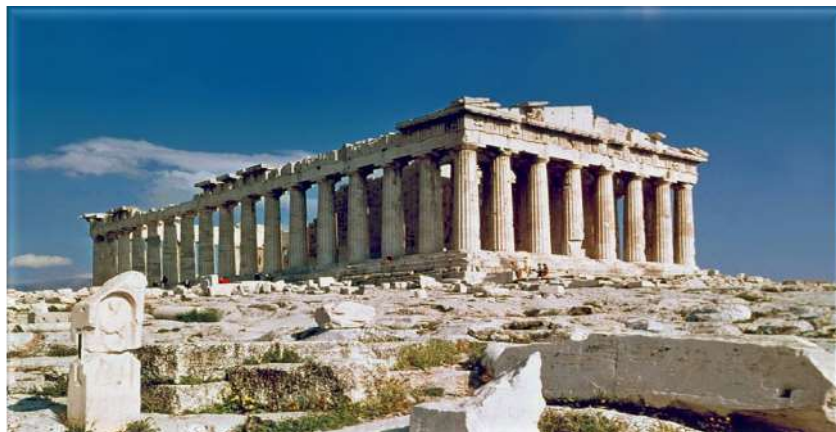
Εικόνα 2: Άποψη του Παρθενώνα