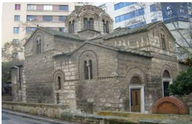
Εικόνα 12: Άγιοι Θεόδωροι