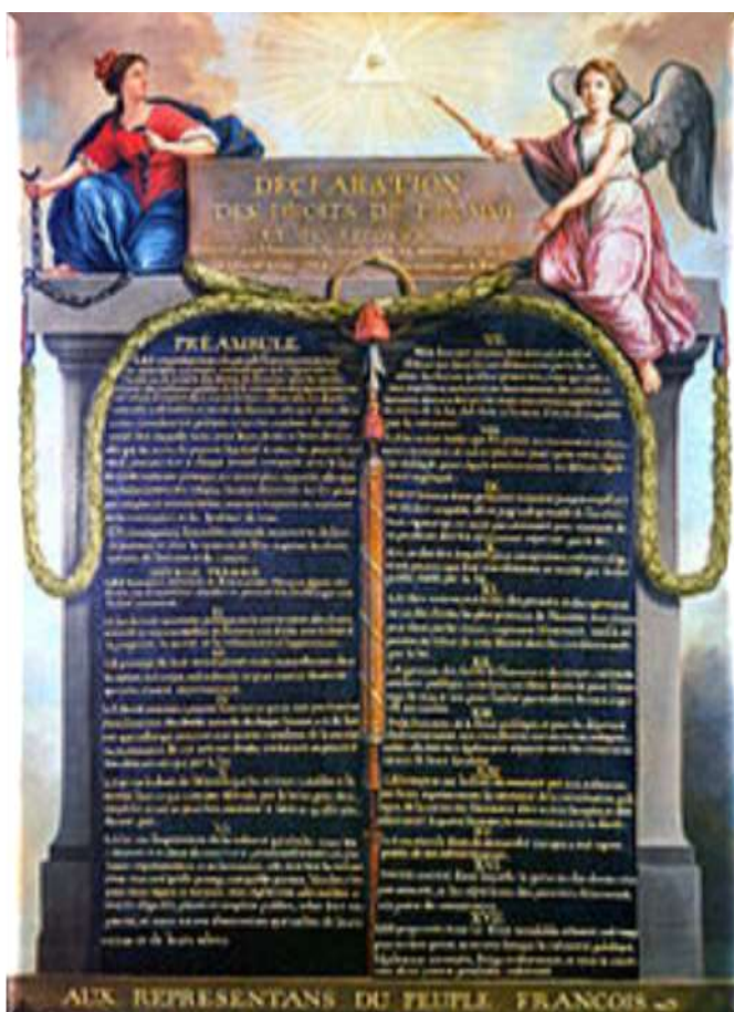
Εικόνα 8: Déclaration des Droits de l'Homme et du Citoyen, του 1789