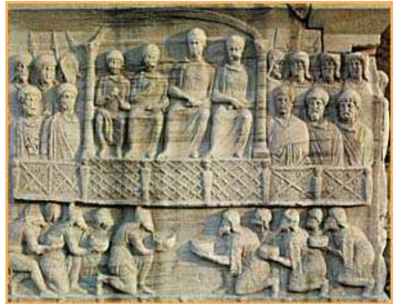
Η βάση του οβελίσκου του Θεοδοσίου Α' στην Κωνσταντινούπολη. 390-391