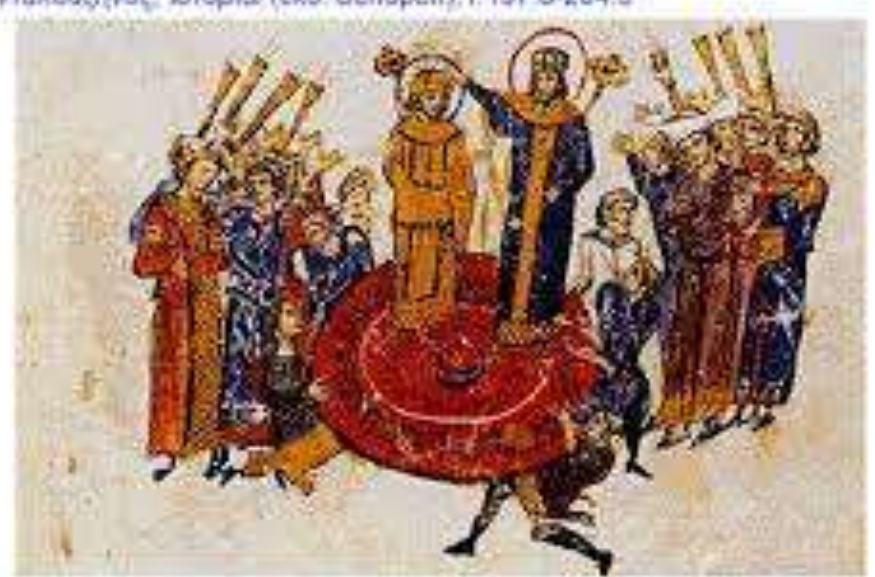
Η μικρογραφία από τον γνωστό κώδικα του Σκωτσέζου, σήμερα στη Μόσκη