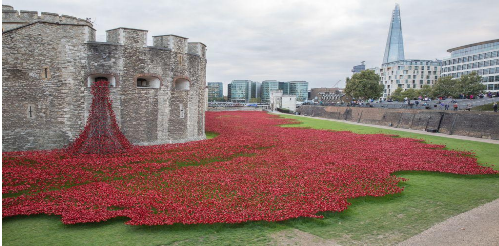
Remembrance Day tastylondon.co.uk