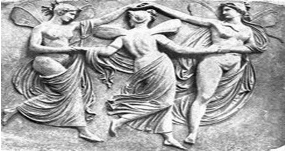
Εικόνα 3 : Ο Χορός στην Αρχαιότητα

https://www.google.gr/search?q=%CE%B9%CF%83%CF%84%CE%BF%CF%81%CE%B9%CE%B1+%CF%84%CE%BF%CF%85+%CF%87%CE%BF%CF%81%CE%BF%CF%85&safe=strict&espv=2&source=Inms&tbm=isch&sa=X&ved=0ahUKEwjf1Pnd2fjSAhXIDsAKHfyUDA4Q_AUIBigB&biw=1024&bih