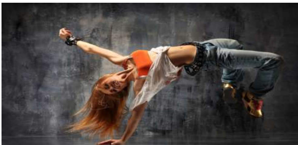
Εικόνα 5 : Street dance

Το Street dance αναφέρεται σε στυλ χορού-ανεξάρτητα από τη χώρα προέλευσης-που εξελίχθηκε έξω από στούντιο χορού σε οποιοδήποτε διαθέσιμο ανοιχτό χώρο, όπως σε δρόμους, πάρτυ, νυχτερινά κέντρα και σχολεία. Συχνά είναι αυτοσχεδιαστικού και κοινωνικού χαρακτήρα, ενθαρρύνοντας την αλληλεπίδραση και την επικοινωνία με τους θεατές και άλλους χορευτές. Αυτοί οι χοροί είναι ένα μέρος της κουλτούρας της γεωγραφικής περιοχής που προέρχονται. Δύο παραδείγματα του street dance περιλαμβάνουν το B-boying (breakdancing), το οποίο προέρχεται από την Νέα Υόρκη και το Shuffle Μελβούρνης από την Αυστραλία.