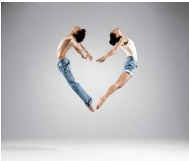
Εικόνα 18 : Η ευεξία μέσα από τον χορό

http://kosmoslarissa.gr/blog/%CE%9B%CE%AC%CF%81%CE%B9%CF%83%CE%B1/%CF%83%CF%85%CE%B3%CF%87%CF%81%CE%BF%CE%BD%CE%BF%CF%82-%CF%87%CE%BF%CF%81%CE%BF%CF%82-%CE%B3%CE%B9%CE%B1-%CE%B5%CF%86%CE%B7%CE%B2%CE%BF%CF%85%CF%82-%CE%BA%CE%