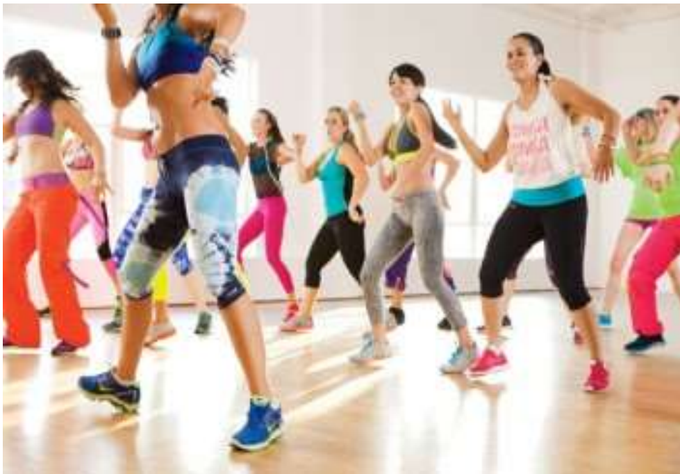
Εικόνα 3 : Zumba

Η Zumba είναι ένα πρόγραμμα γυμναστικής, το οποίο προέρχεται από την ομώνυμη κολομβιανή λέξη που σημαίνει «γρήγορη κίνηση» και είναι το μοναδικό πρόγραμμα χορού-γυμναστικής που συνδυάζει λάτιν μοτίβα από τη samba, τη salsa, το cha cha, το mambo και τη merengue με δυναμικές κινήσεις από το σύγχρονο hip hop με τους ανατολίτικους ρυθμούς του belly dance .