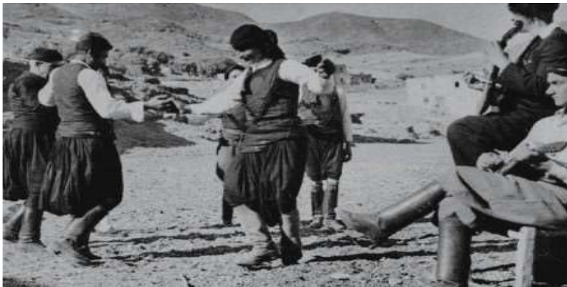
Εικόνα 4 : Ο Χορός στα ελληνικά εδάφη

https://www.google.gr/search?q=%CE%B9%CF%83%CF%84%CE%BF%CF%81%CE%B9%CE%B1+%CF%84%CE%BF%CF%85+%CF%87%CE%BF%CF%81%CE%BF%CF%85&safe=strict&espv=2&source=Inms&tbm=isch&sa=X&ved=0ahUKEwjf1Pnd2fjSAhXIDsAKHfyUDA4Q_AUIBigB&biw=1024&bih