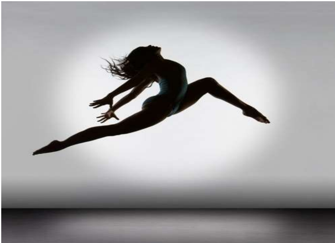
Εικόνα 1 : Ο Χορός ως έκφραση

Το αντικείμενο με το οποίο ασχοληθήκαμε κατά την διάρκεια του 2 ου τετραμήνου είναι ο Χορός, ο οποίος συγκαταλέγεται σε μια ευρύτερη ενότητα «Τέχνες, Ταλέντο και Πολλαπλή Νοημοσύνη» που είναι ο τίτλος της ερευνητικής μας εργασίας, μαζί με άλλα είδη και εκφράσεις τέχνης. Σκοπός μας είναι η ανάλυση και η διερεύνηση του Χορού, ως αντικείμενο μελέτης, σε ιστορικό, ψυχοσωματικό και χωροκινητικό επίπεδο. Από την ιστορική προέλευση μέχρι την εισαγωγή στην εκπαιδευτική διαδικασία, θα αποκτήσουμε την δυνατότητα να εμβαθύνουμε στην έννοια "χορός", αποδεικνύοντας την δίκαιη ανάδειξή του σε Τέχνη.