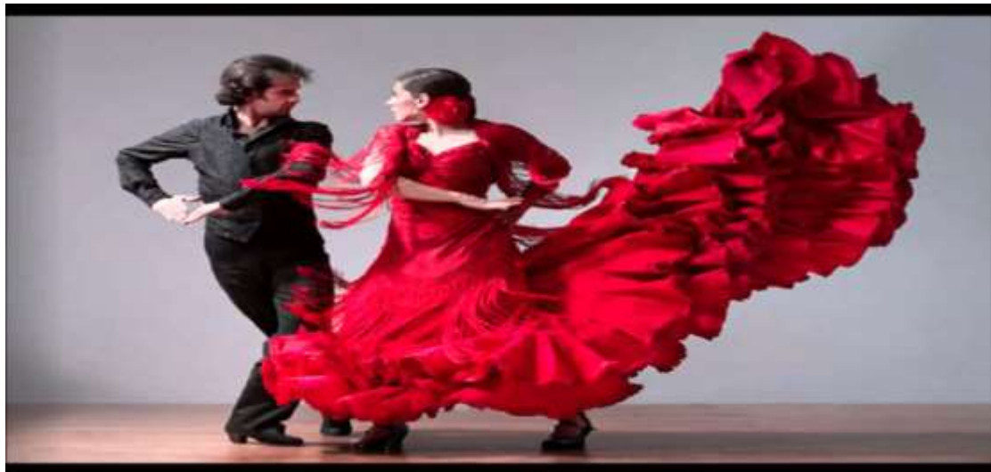
Εικόνα 10 : Paso Doble

Έχει υιοθετήσει πολλά κινησιολογικά στοιχεία από τον παραδοσιακό ισπανικό χορό FLAMENCO. Το PASO DOBLE είναι ο μόνος λάτιν χορός με το 'υψηλότερο' κράτημα και με ανύπαρκτη κίνηση γοφών.