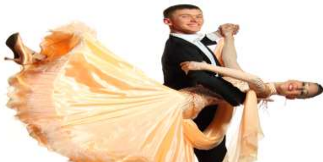
Εικόνα 14 : Fox-Trot

https://www.google.gr/search?q=foxtrot+dance&safe=strict&espn=2&source=Inms&tbn=isch&sa=X&ved=0ahUKEwiz-8no1PjSAhWHC5oKHSFxAcoQ_AUIBigB&biw=1024&bih=662#imgrc=tWQYk4UC8knbnvM: