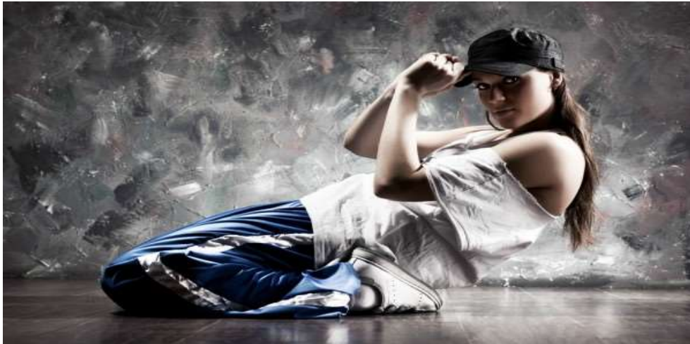
Εικόνα 6 : Freestyle

Το freestyle είναι ένας σφαιρικός όρος που καλύπτει τις μορφές του χορού που δημιουργήθηκαν έξω από το στούντιο χορού. Χαρακτηρίζεται από τον αυτοσχεδιασμό και ένα επιθετικό στυλ.