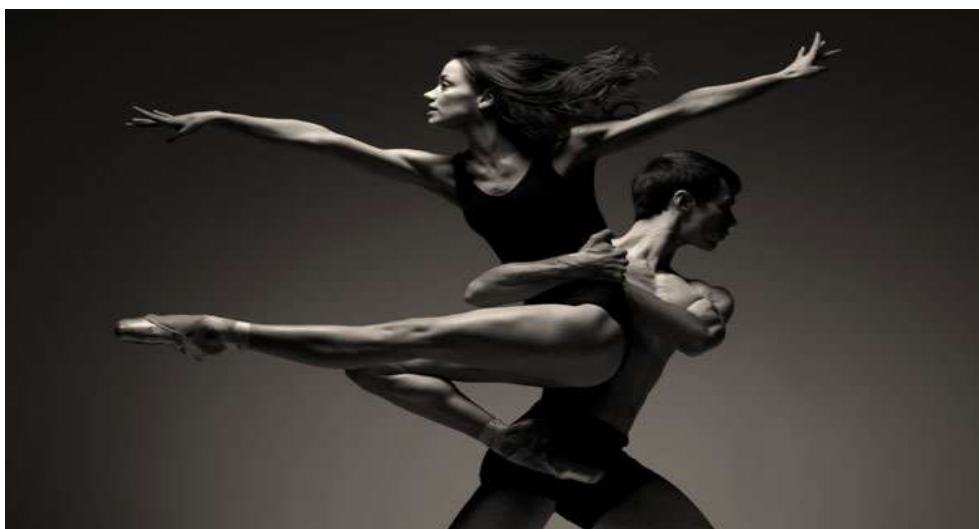
Εικόνα 7 : Σύγχρονος Χορός

Ο σύγχρονος χορός σε συνδυασμό με τις γνώσεις του κλασικού χορού, εφοδιάζει τον χορευτή με μεγαλύτερη εκφραστικότητα και καλύτερη τεχνική.