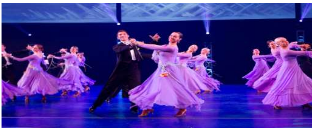
Εικόνα 12 : Ballroom

Ο όρος «χοροί ballroom» έχει αποκτήσει κατά καιρούς διάφορες ερμηνείες, ενώ υπάρχει διάσταση απόψεων πάνω στη σημασία του όρου ακόμα και ανάμεσα σε ειδικούς. Κάποιες εκδοχές προβάλλουν τους χορούς Ballroom ως χορούς που χορεύονται σε μεγάλες αίθουσες. Η αρχική ερμηνεία ήταν ο χορός για ζευγάρια (παρτενέρ) σε μεγάλη αίθουσα χορού. Εκείνη την εποχή Ballroom χοροί θεωρούνταν οι απαλοί χοροί με προοδευτική κίνηση στο χώρο, όπως το Waltz.