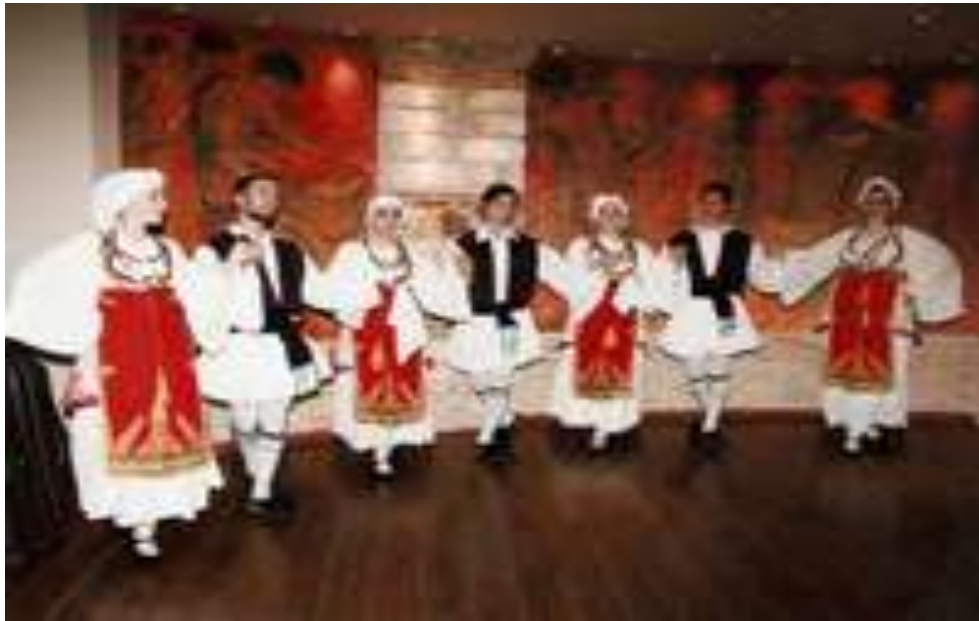
Εικόνα 8 : Παραδοσιακός Χορός