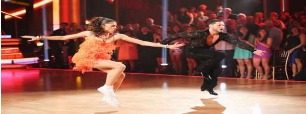
Εικόνα 11 : Jive

Ο πιο γρήγορος, ο πιο ενεργητικός και ο πιο παιχνιδιάρικος Latin χορός. Κάνει όλο το σώμα μέσο έκφρασης, με κινήσεις γεμάτες δύναμη, ευλυγισία και εφευρετικότητα.