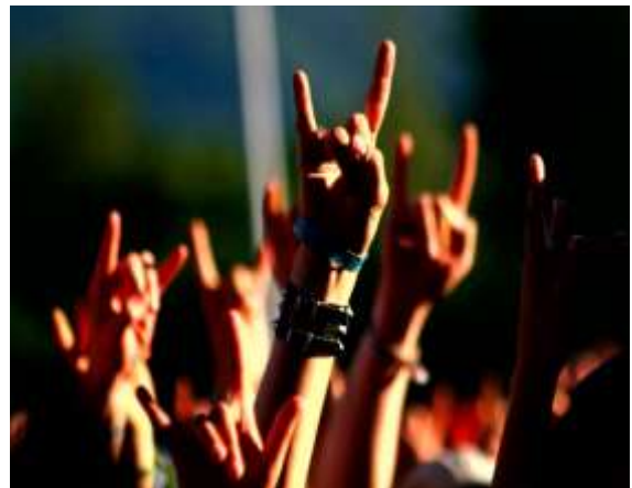
ΤΟ ΣΗΜΑ ΚΑΤΑΤΕΘΕΝ ΤΗΣ ΡΟΚ