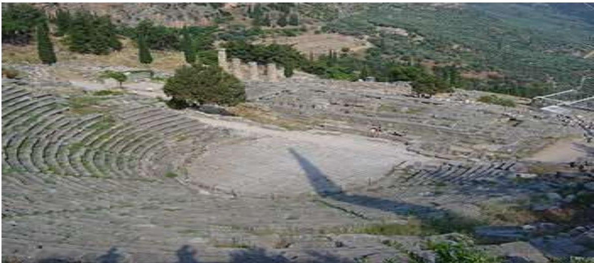
Αρχαίο θέατρο Δελφών

καταλάμβαναν τις ειδικές τιμητικές θέσεις τους, άρχιζαν οι παραστάσεις, που έκλειναν αναδεικνύοντας τους νικητές του τραγικού αγώνα το βράδυ της πέμπτης ημέρας της εορτής. Στα Μεγάλα Διονύσια, οι τρεις τραγικοί ποιητές που έπαιρναν μέρος αγωνίζονταν με τέσσερα δράματα, τρεις τραγωδίες και ένα σατυρικό δράμα, σε αντίθεση με την κωμωδία που αγωνίζονταν πέντε ποιητές, που παρουσίαζαν ένα μόνον έργο τους. Στα Λήγαια, που δεν είχαν πανελλήνιο χαρακτήρα όπως τα Διονύσια, η τραγωδία βρισκόταν σε κατώτερη θέση σε σχέση με την κωμωδία και έτσι έλειπε η συμμετοχή των μεγάλων τραγικών. Τα χρόνια που διήρκησε ο πελοποννησιακός πόλεμος (431-404 π.Χ.) διδάσκονταν τρεις κωμωδίες, η καθεμία μετά την τετραλογία κάθε τραγικού ποιητή.