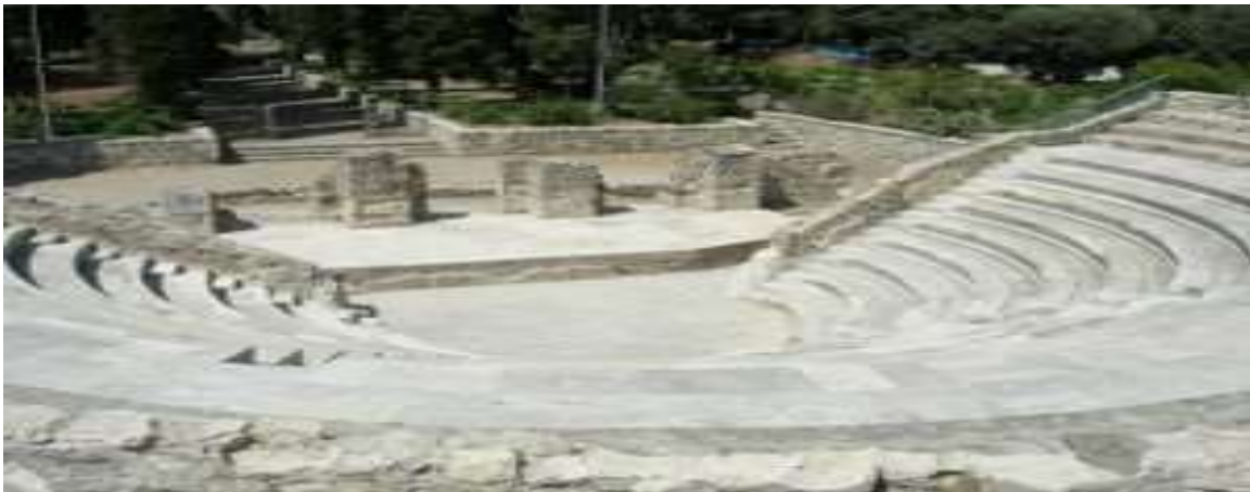
Το Ρωμαϊκό Ωδείο στην Κω

Η προεδρία : η πρώτη σειρά των καθισμάτων όπου κάθονταν οι επίσημοι.