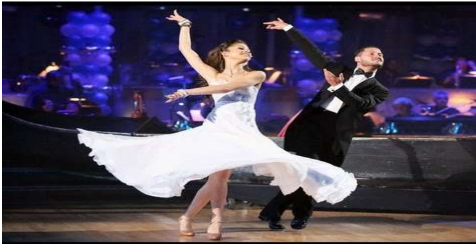
Εικόνα 15 : Viennese Waltz

Είναι η πιο γρήγορη εκδοχή του γνωστού waltz. Απαλή, συνεχόμενη κίνηση, ισορροπία, ωραίο παρουσιαστικό, έντονο, αρμονικό ύψος-βάθος. Γεννήθηκε κατά το 1812.