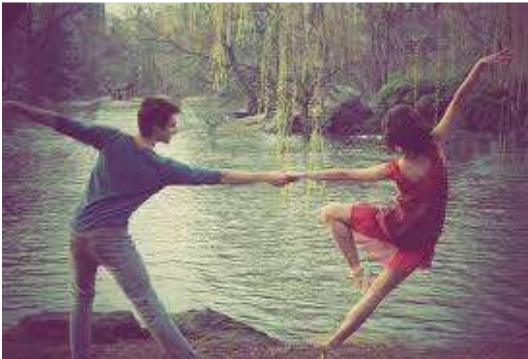
Εικόνα 2 : Χορός

Είναι ο τύπος νοημοσύνης που χαρακτηρίζει χορευτές, αθλητές, μίμους, τεχνίτες, ηθοποιούς, χειρουργούς κ.α.