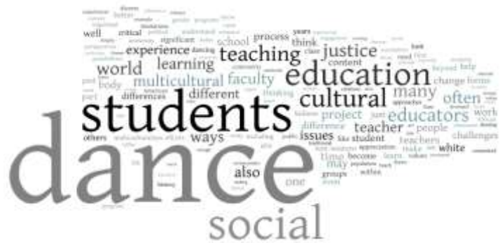
Εικόνα 19 . Χορός και Εκπαίδευση

εισηγητή. Οι αρχαίοι ημών πρόγονοι επισήμαιναν : «Νους υγιής εν σώματι υγιή». Ίσως η διαχρονικότητα της συγκεκριμένης ρήσης δεν ενστερνίζεται από τους απογόνους. Ίσως πλέον το κέντρο βάρους να έχει μετατοπιστεί στην απόκτηση της γνώσης με σκοπό την ανταγωνιστικότητα, με αποτέλεσμα να παραμεληθεί η φροντίδα του σώματος, μέσα από την οποία ανυψώνεται η ψυχή.