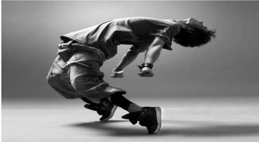
Εικόνα 4 : Hip-hop

https://gr.pinterest.com/pin/566538828099511576/