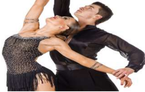
Εικόνα 9 : Rumba

https://www.google.gr/search?q=rumba+dance&safe=strict&espv=2&source=Inms&tbm=isch&sa=X&ved=0ahUKEwi17sb32_jSAhWLI8AKHVHICeUQ_AUIBigB&biw=1024&bih=662#imgsrc=rKjG3BChPjtF7M:]