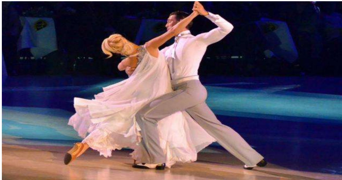
Εικόνα 13 : Waltz

Δημιουργήθηκε από τους τοπικούς λαϊκούς χορούς της Αργεντινής τον 19ο αιώνα, η διαμόρφωση του στυλ του περιέχει πολλά στοιχεία από Βραζιλία , Ισπανία και Μεξικό . Εμφανίστηκε κατά την διάρκεια του 1919 στην Αμερική, αλλά απαγορεύτηκε το 1930 , καθώς θεωρήθηκε άκρος προκλητικός και ερωτικός χορός, εξαιτίας της στενής επαφής των σωμάτων και ορισμένων φιγούρων .