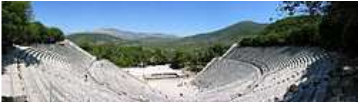
Άποψη του θεάτρου της Επιδαύρου

Κάτοψη αρχαίου ελληνικού θεάτρου και τα μέρη σκηνής, ορχήστρας και κοίλου