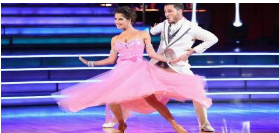
Εικόνα 16 : Quick Step

Είναι ένας μοντέρνος χορός δυναμικός, ευχάριστος και πολύ ζωντανός, ίσως ο πιο διασκεδαστικός από τους άλλους ballroom χορούς.