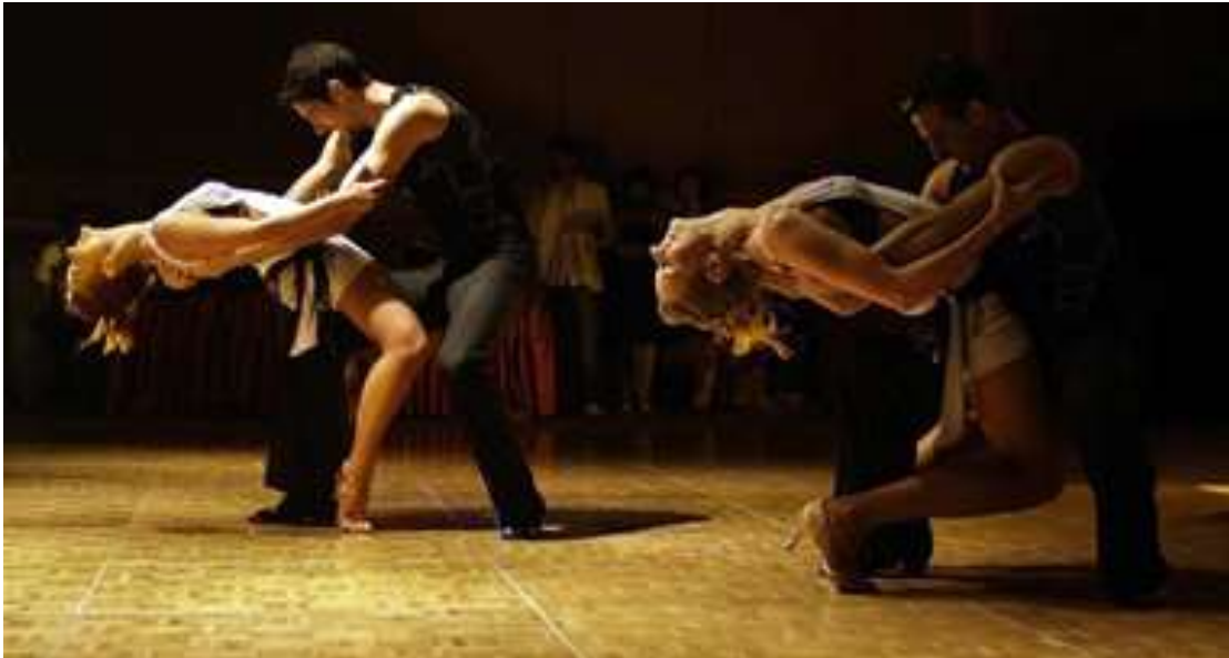
Εικόνα 17 : Bachata

Είναι μια μορφή μουσικής και λάτιν χορού που δημιουργήθηκε στην επαρχία και της αγροτικές γειτονιές της Δομινικανής δημοκρατίας. Τα θέματα του είναι συχνά ρομαντικά, ιδιαίτερα επικρατούσες είναι οι ιστορίες αγάπης κα θλίψης.