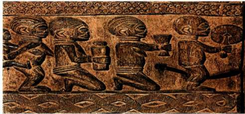
Οι προσφορές αποτελούν τον κυριότερο τίμιο λατρείας.

«Ο ουρανός όπου κατοικεί ο Θεός, ήταν κάποτε πολύ κοντύτερα από ό,τι είναι σήμερα. Τόσο κοντά ήταν που οι άνθρωποι μπορούσαν να τον αγγίξουν. Αλλά μια μέρα κάποιες γυναίκες πήραν κομμάτια από τον ουρανό για να τα μαγειρέψουν στη σούπα. Τότε ο Θεός θύμωσε και απομακρύνθηκε στη σημερινή του απόσταση».