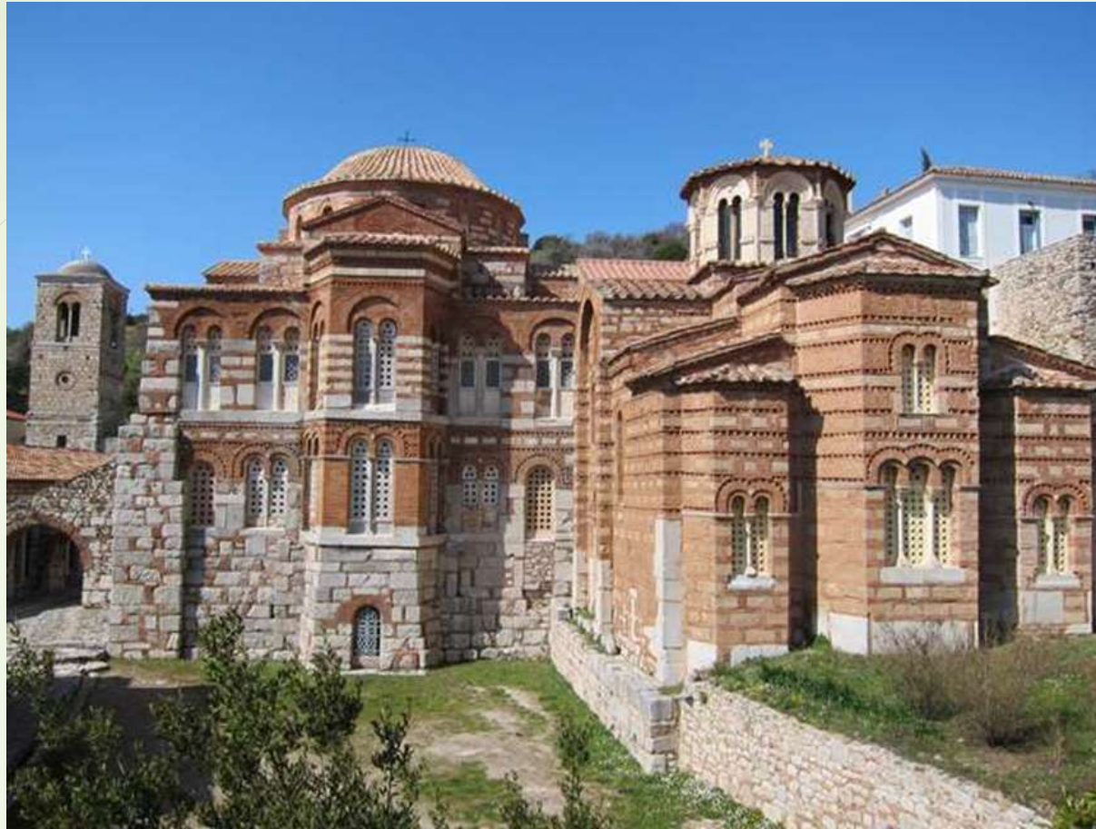
Ναός της Παναγίας