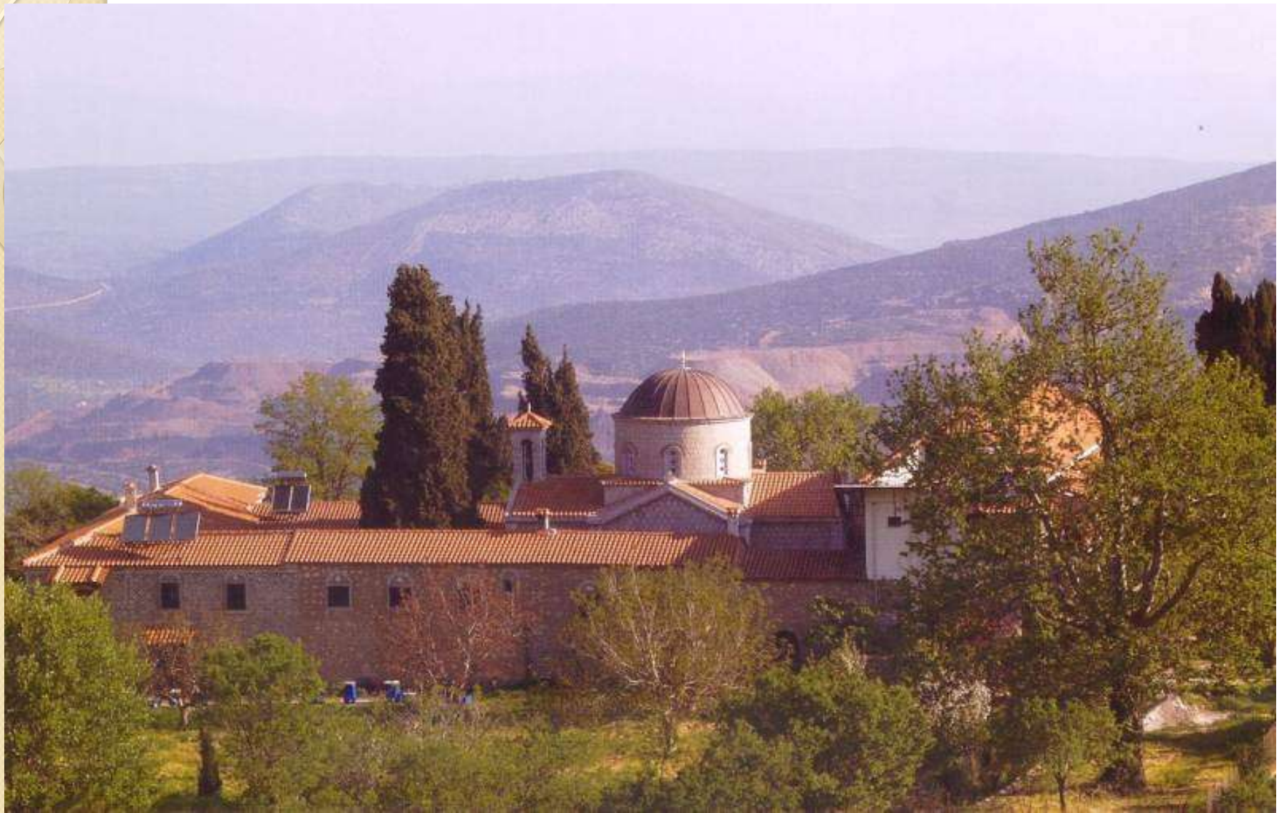
Μονή της Πελαγίας Ακραιφνίου Βοιωτίας