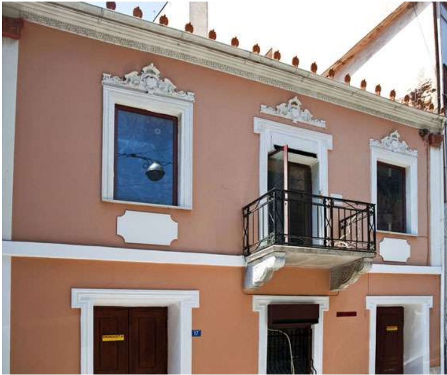
Πρόσοψη νεοκλασικού κτιρίου

Ο νεοκλασικισμός επέζησε στην Ελλάδα ως τις πρώτες δεκαετίες του 20ου αιώνα και πέρα από την επίσημη και μνημειακή τέχνη, αφού άσκησε βαθιά επιρροή στην λαϊκή αρχιτεκτονική της εποχής. Για την Ελλάδα του προηγούμενου αιώνα, ο ρομαντισμός αυτός έγινε πίστη αναμφισβήτητος που οδήγησε στη δημιουργία ενός πλήθους αρχιτεκτονικών και καλλιτεχνικών έργων, σε μια καλλιτεχνική περίοδο, της οποίας μόλις τώρα, μπορούμε να αποτιμήσουμε το μέγεθος και τις αρετές.