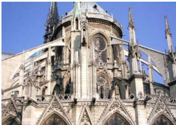
Καθεδρικός ναός της Παναγίας των Παρισίων

δυτική Ευρώπη. Την γοθτική τέχνη παρέλαβε η περίοδος της Αναγέννησης, αν και δείγματα γοθικών δημιουργιών καταγράφονται και μέχρι το τέλος του 15ου αιώνα.