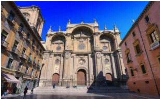
Καθεδρικός ναός Γρανάδας

Η Αναγεννησιακή τέχνη δεν χαρακτηρίστηκε από μια επιστροφή στο παρελθόν, αντίθετα, οι νέες τεχνικές σε συνδυασμό με το νέο πολιτικό, κοινωνικό και επιστημονικό επίπεδο που μορφοποιήθηκε εκείνη την εποχή, επέτρεψαν στους καλλιτέχνες να καινοτομήσουν. Επίσης, για πρώτη φορά, η τέχνη έγινε προσωπική, με την σημασία πως δεν μορφοποιήθηκαν από τη θρησκευτική ή πολιτική εξουσία, αλλά απαρτίστηκε ως προϊόν αποκλειστικά των ίδιων των καλλιτεχνών.