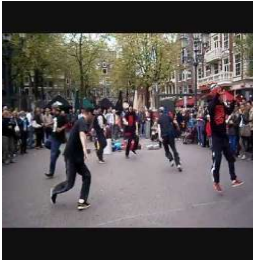
Εικόνα 2 Στιγμιότυπο του χορού HIP HOP