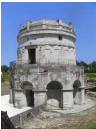
Το Μανσωλείο του Θεοδώριχου στη Ραβέννα της Ιταλίας, μοναδικό σωζόμενο δείγμα της αρχιτεκτονικής των Οστρογότθων.

τις κοσμικές υποθέσεις.. Κατά τον 4 ο αιώνα ο Ιερώνυμος είδε σε όραμα ότι ο Θεός τον επέληξε επειδή ξόδευε περισσότερο χρόνο μελετώντας τον Κικέρωνα παρά τις Γραφές. Τον 6 ο αιώνα ο Γρηγόριος της Τουρ αναφέρει ένα παρόμοιο όραμα, στο οποίο όμως έλαβε επίπληξη επειδή μάθαινε στενογραφία. Μέχρι τα τέλη του 6 ου αιώνα, σε κύρια μέσα θρησκευτικής επιμόρφωσης στην Εκκλησία είχαν μετατραπεί η τέχνη και η μουσική κι όχι η ανάγνωση κειμένων. Οι περισσότερες λόγιες προσπάθειες κινούνταν προς τη μίμηση της κλασικής γραμματείας, αν και δημιουργήθηκαν και κάποια πρωτότυπα έργα, από κοινού με προφορικές συνθέσεις που δεν διασώζονται στις μέρες μας. Τα γραπτά των Σιδώνιου Απολλινάριου, Κασσιόδωρου και Βοήθιου είναι χαρακτηριστικά της εποχής.