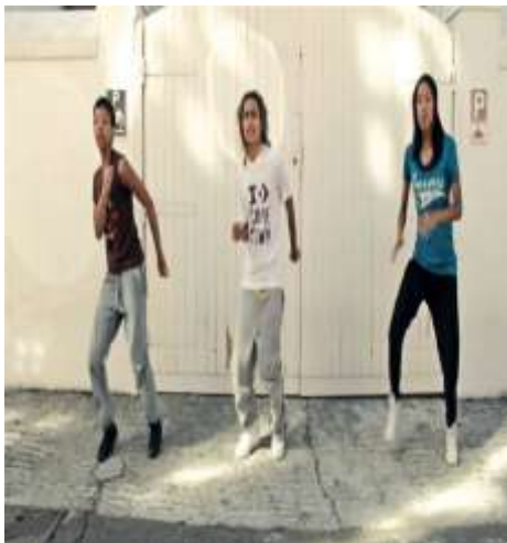
Εικόνα 5 Στιγμιότυπο του χορού House Dance-

Έχει συχνά αυτοσχεδιαστικό χαρακτήρα και δίνει έμφαση στη γρήγορη και πολύπλοκη κίνηση των ποδιών σε συνδυασμό με κινήσεις του κορμού καθώς και φιγούρες στο έδαφος