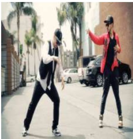
Εικόνα 3 Στιγμιότυπο του χορού Locking

Στηρίζεται σε γρήγορες και διακριτές, γενικά μεγάλες και υπερβολικές, κινήσεις ολόκληρου του σώματος, ενώ σημαίνει και το «κλείδωμα» σε μία συγκεκριμένη θέση. Θεωρείται δύσκολο είδος χορού καθώς οι κινήσεις του σώματος είναι συγκεκριμένες και οι τραυματισμοί των χορευτών είναι συχνοί