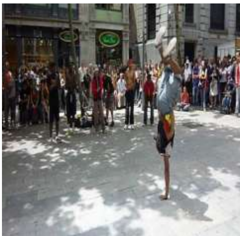
Εικόνα 1 Στιγμιότυπο του χορού Break Dance