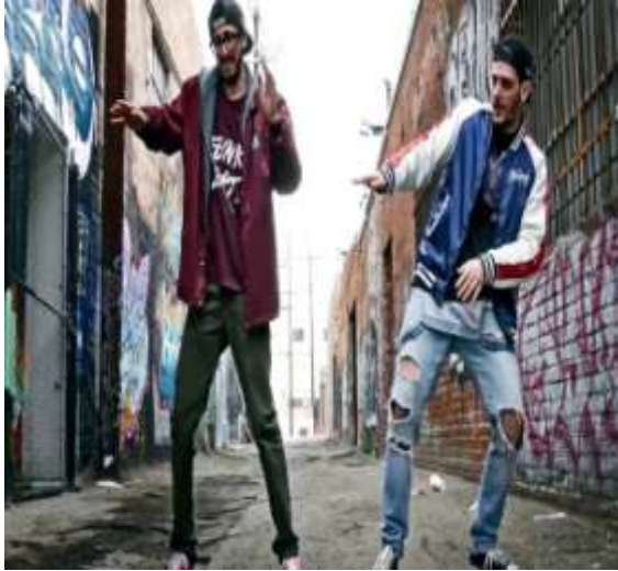
Εικόνα 4 Στιγμιότυπο του χορού Popping

Βασίζεται στην τεχνική της γρήγορης συμβαλλόμενης και χαλάρωσης των μυών, ώστε να προκληθεί τράνταγμα στο σώμα του χορευτή