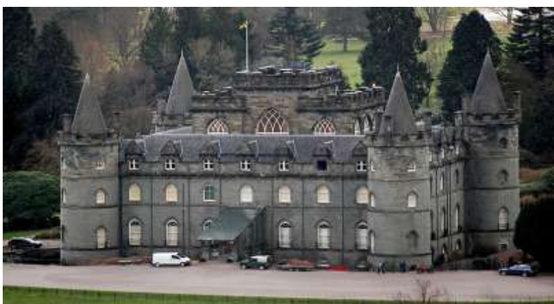
Το κάστρο Ινβαράρει στην Σκωτία, χτισμένο τον 17ο αιώνα