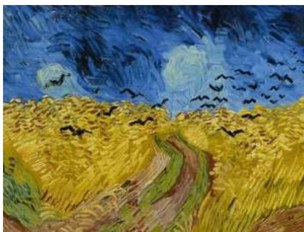
Το χωράφι με τα κοράκια

Το Μάιο του 1890 αποφασίζει να μεταφερθεί στο Ωβέρ-συρ-Ουάζ, όπου ο γιατρός Γκασέ αναλαμβάνει να τον φροντίσει. Μακριά από το παραισθησιακό περιβάλλον του άσυλου ο ζωγράφος περνάει μια αρκετά ευτυχισμένη εποχή, που αντανakλά το έργο του. Διακρίνει κανείς σε αυτό μια μακαριότητα,, μια συμπάθεια για τον κόσμο, αλλά η ηρεμία αυτή είναι απατηλή και διακόπτεται συχνά από βίαια