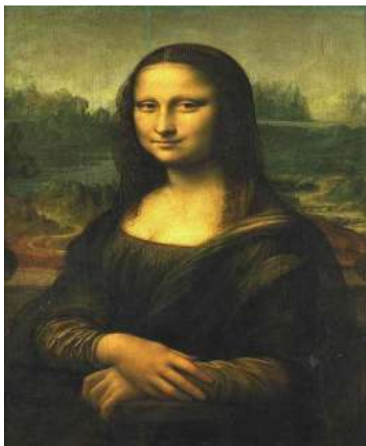
Λεονάρντο Ντα Βίντσι , Μόνα Λίζα , 77x53 εκ.

Ο ξακουστός Leonardo da Vinci (1452-1519) γεννήθηκε σε ένα χωριό της Τοσκάνης. Μαθήτευσε στη Φλωρεντία και ήταν μαθητής του Andrea Del Verrochio (1435-1488), που ήταν ζωγράφος και γλύπτης. Στο σπουδαίο αυτό εργαστήριο έμαθε πολλά πράγματα. Μυήθηκε στα τεχνικά μυστικά του χυτηρίου και της επεξεργασίας του μετάλλου, έμαθε να προετοιμάζει προσεχτικά πίνακες και γλυπτά κάνοντας πρακτική με μοντέλα, γυμνά ή ντυμένα. Μελέτησε φυτά και ζώα τα οποία ενέταξε στα έργα του και έμαθε καλά τις αρχές της προοπτικής και της χρήσης του χρώματος. Ήταν μία μεγαλοφυΐα που η διανοητική της δύναμη έγινε