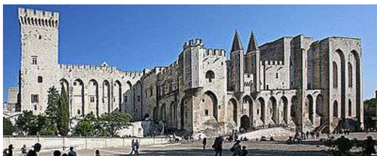
Το παπικό ανάκτορο στη γαλλική πόλη Αβινιόν, ένα από τα μεγαλύτερα και σημαντικότερα μεσαιωνικά γοθικά κτίσματα στην Ευρώπη