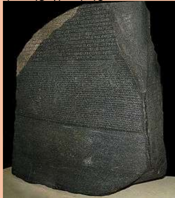
Η στήλη της Ροζέτας

Στις πρώτες περιλαμβάνονται κείμενα που έχουν χαραχτεί είτε στην επιφάνεια μνημειωδών οικοδομημάτων όπως οι ναοί και οι πυραμίδες είτε σε στήλες προορισμένες ειδικά για αυτό το σκοπό. Έχουν βρεθεί επιγραφές ιερογλυφικούς χαρακτήρες που ανάγονται στα τέλη της 4 ης και στις αρχές της 3 ης χιλιετίας προ Χριστού. Μια από τις περιφημότερες επιγραφές είναι αυτή που βρέθηκε εγχάρακτη στη στήλη της Ροζέτας, το δίγλωσσο κείμενο τις όποιας βοήθησε στην αποκρυπτογράφηση της ιερογλυφικής γραφής.