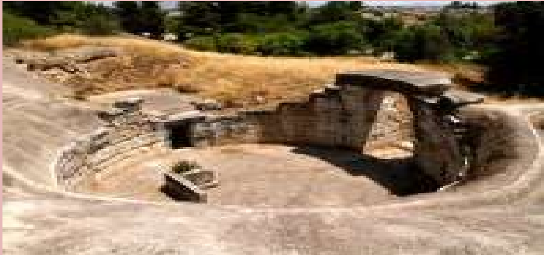
Θολωτός τάφος: http://www.orchomenos.gr