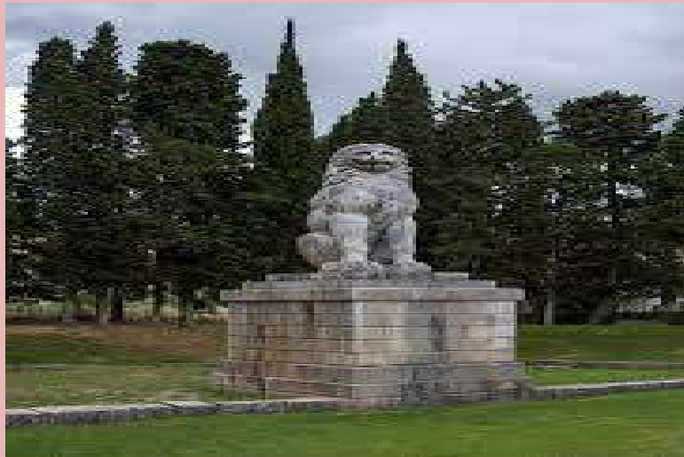
Λέων Της Χαιρώνειας mthv.gr